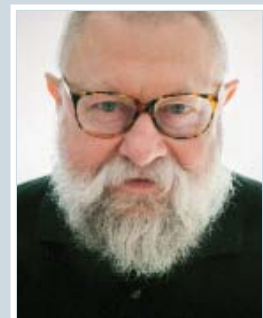
Prof. dr hab. Jerzy Bralczyk Przewodniczący Rady Programowej Europejskiego Forum Prawa i Edukacji

Miejsce: Warszawa, Pałac Staszica, ul. Nowy Świat 72, sala Marii Skłodowskiej-Curie nr 126.