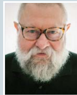
Prof. dr hab. Jerzy Bralczyk Przewodniczący Rady Programowej Europejskiego Forum Prawa i Edukacji

Miejsce: Warszawa, Pałac Staszica, ul. Nowy Świat 72.